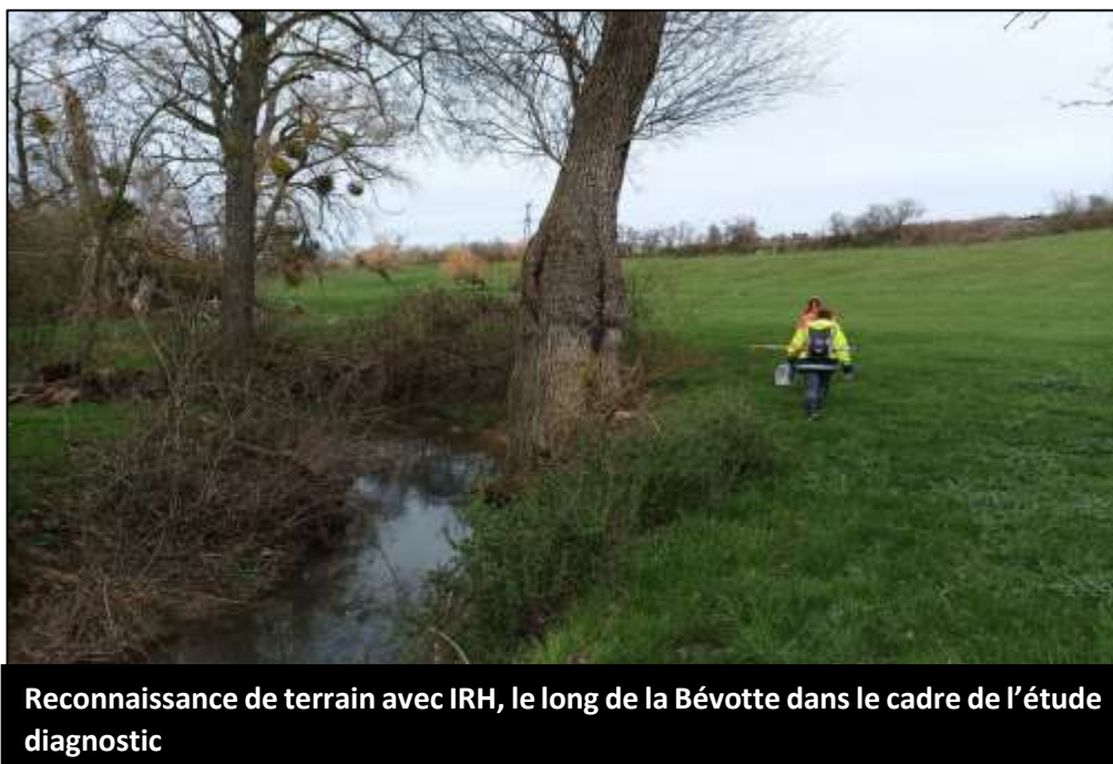
Reconnaissance de terrain avec IRH, le long de la Bévotte dans le cadre de l'étude diagnostic

Les précédents diagnostics ont fait ressortir que le bassin versant de la Bévotte restait le plus naturel des quatre. Le Syndicat a choisi de lancer une actualisation de l'état des lieux de ce bassin versant. A l'issue d'une consultation, le Bureau d'études IRH Conseil a été désigné pour réaliser cette mission qui devrait s'achever courant de l'automne 2023. La commande est passée pour un montant de 60 000€ TTC.